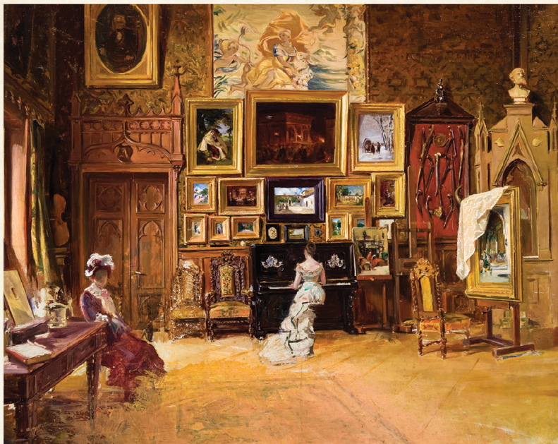
THEODOR AMAN, În atelierul artistului

Deși a rămas orfan de tată încă de la vârsta de trei ani, Theodor Aman a avut privilegiul de a primi o educație aleasă, moștenind pasiunea pentru MUZICA CLASICĂ de la mama lui. El însuși cânta adesea la VIOLONCEL (instrument expus în prezent la MUZEUL THEODOR AMAN ) în cadrul diferitelor recepții, serate muzicale sau baluri costumate pe care le găzduia în atelierul său. La una dintre aceste serate, artistul a cântat chiar în prezența reginei Elisabeta, prima regină a României, renumită pentru contribuția sa la susținerea și promovarea culturii române.