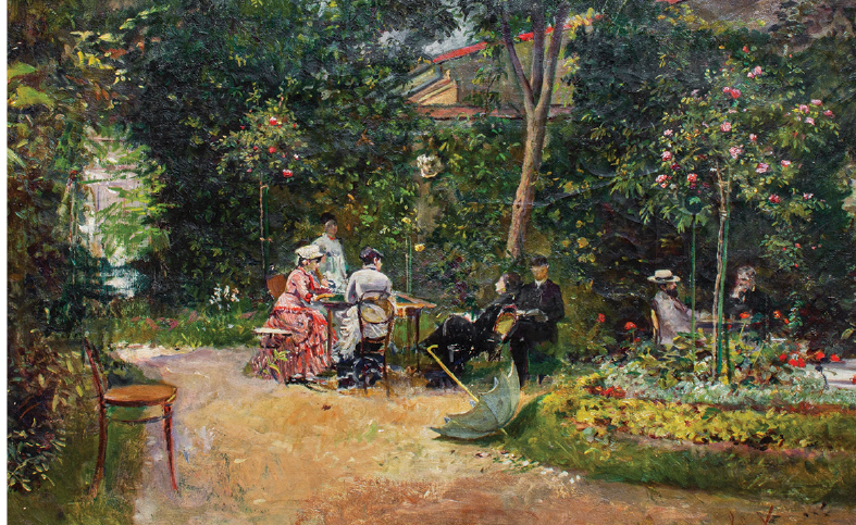
THEODOR AMAN, În grădina autorului