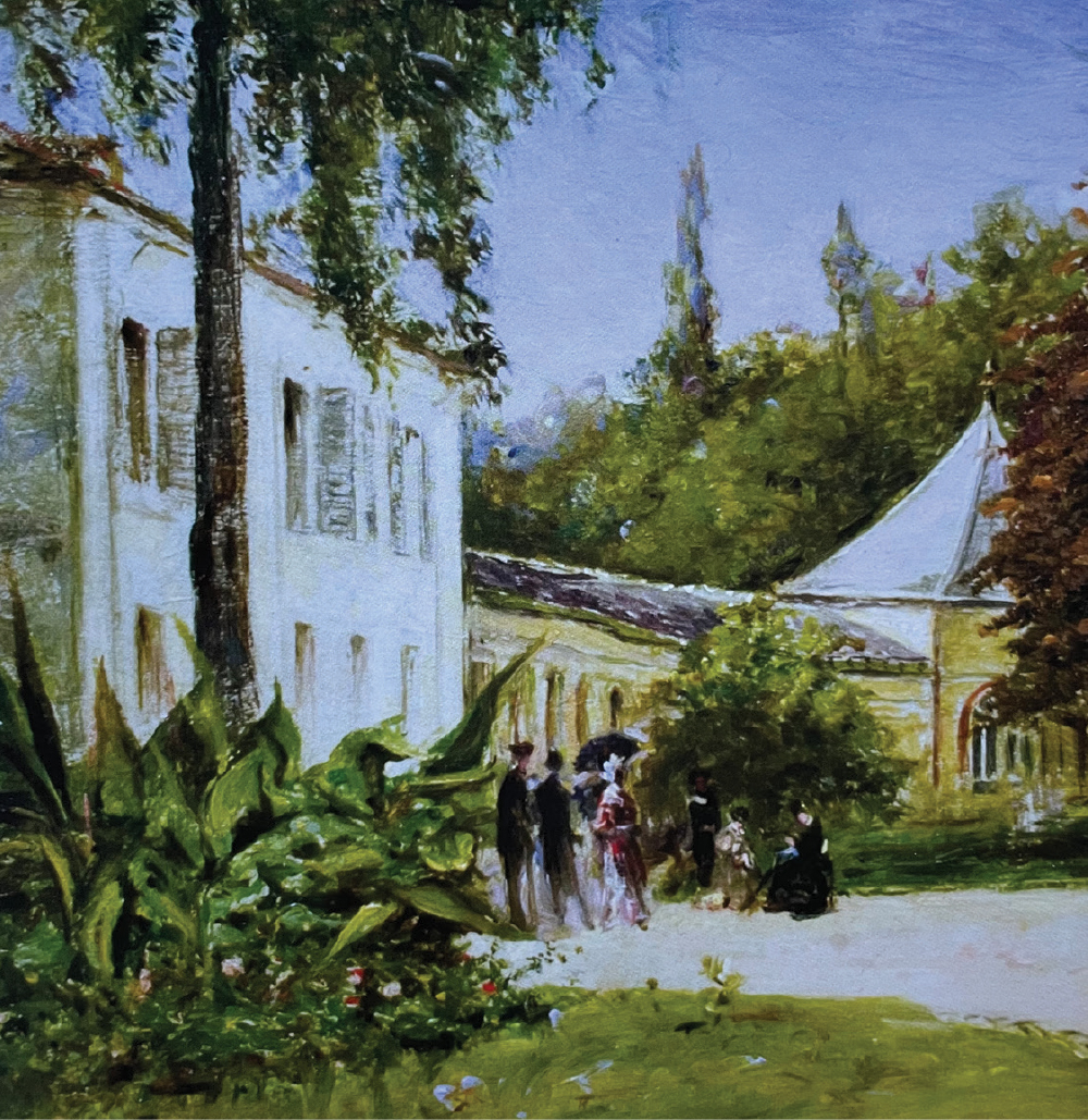
THEODOR AMAN, Plimbare în parc