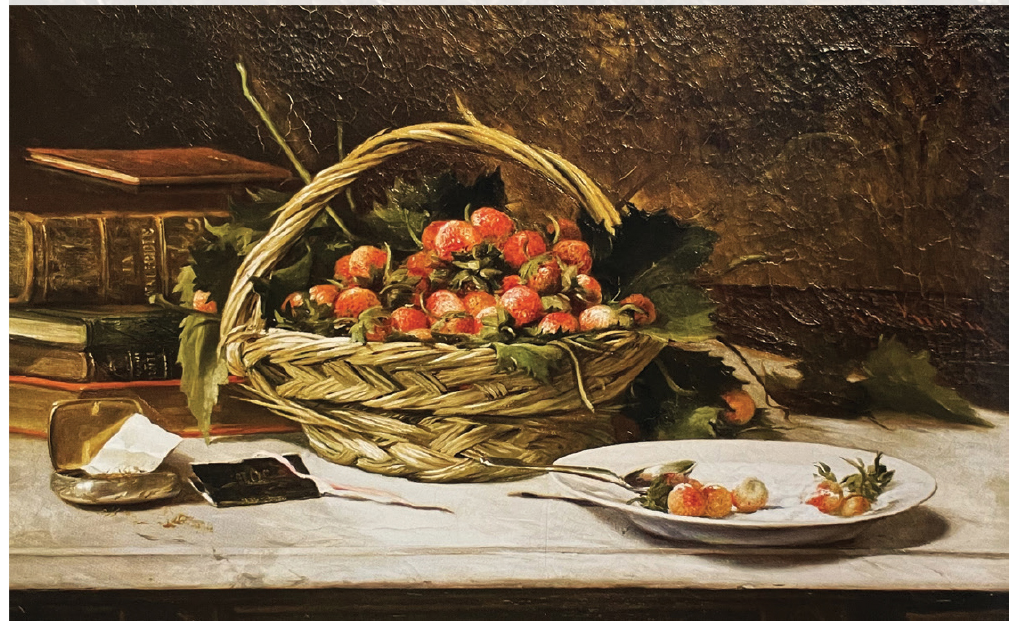
THEODOR AMAN, Coș cu fragi

Theodor Aman este primul pictor român care studiază la Școala Națională Superioară de Arte Frumoase din Paris, într-o perioadă în care doar portretul și scenele istorice sau cele inspirate din mitologie erau considerate genuri artistice majore. La revenirea din Franța, el se va ocupa, precum toți artiștii importanți ai vremii, în principal de aceste genuri de pictură. NATURA STATICĂ și PEISAJUL vor primi atenția cuvenită din partea pictorului mult mai târziu. Elementele pe care le întâlnim în compozițiile sale cu flori și fructe reproduc aproape fotografic realitatea, precizia desenului fiind una dintre calitățile de necontestat ale artistului.